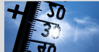
Städte spüren den Hitzestau und greifen zu Massnahmen. Was könnte in Burgdorf gemacht werden?

Es wird immer wärmer in der Stadt. Muss man reagieren? Was machen andere Städte? Input-referat und Diskussion. Eintritt frei, Kollekte, Gäste willkommen.