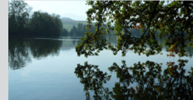
Schon lange fällig: ein See für Burgdorf. Oder gleich zwei?

Wir machen uns auf zu einer Rundfahrt zu fünf möglichen Seen-Standorten in Burgdorf. Mitnehmen: Velo, Picknick. Bei gutem Wetter mit bräteln, ansonsten Picknick am Schermen. Eintritt frei. Gäste willkommen.