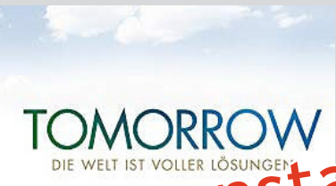
Der Film Tomorrow zeigt in 15 Minuten auf Z...