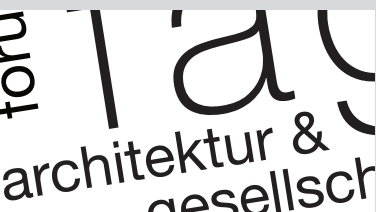
Die «Gesellschaft» rückt in den Fokus des fag.